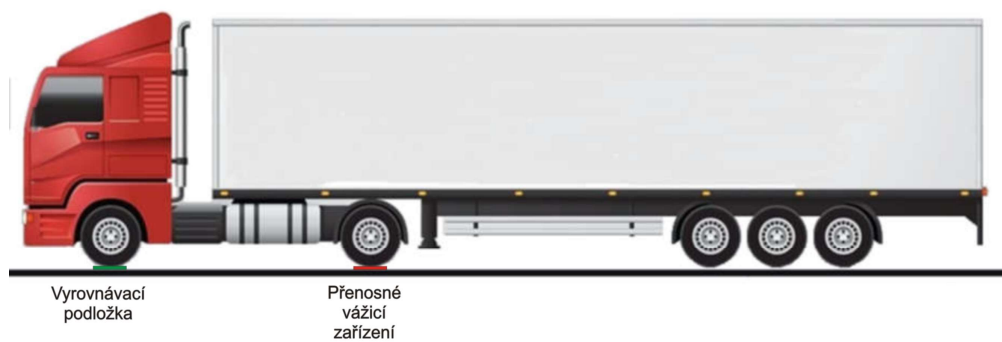
Obrázek 2a – Použití přenosného měřicího zařízení a vyrovnávacích podložek