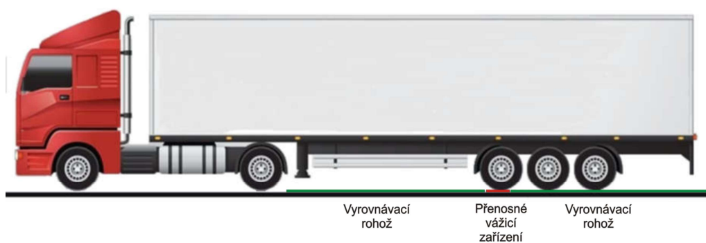
Obrázek 2b – Použití přenosného měřicího zařízení a pomocných rohoží